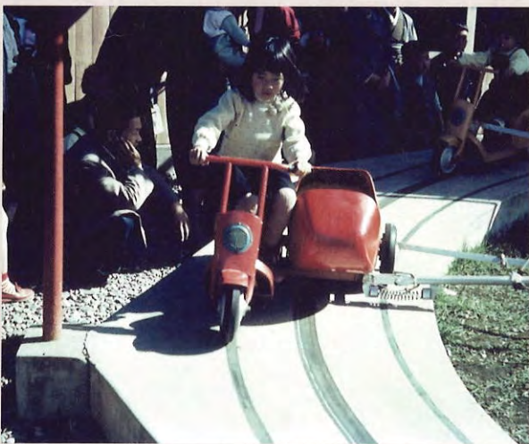
赤いバイクの遊具 (昭和30年代)