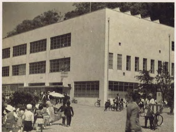
徳島県立図書館 (昭和30年代)