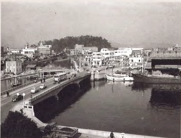
徳島県庁屋上から城山方面 (昭和30年代)