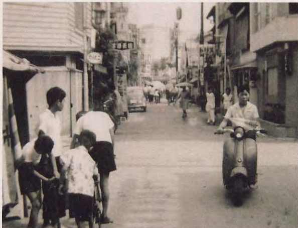
富田町の街並 (昭和32年)