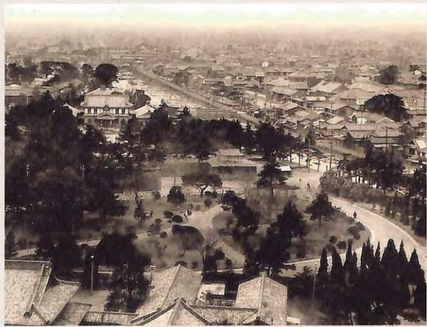
公園山上より望む市街の東部 (戦前)