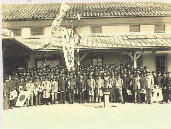
徳島駅にて出征者の見送り（昭和15年）