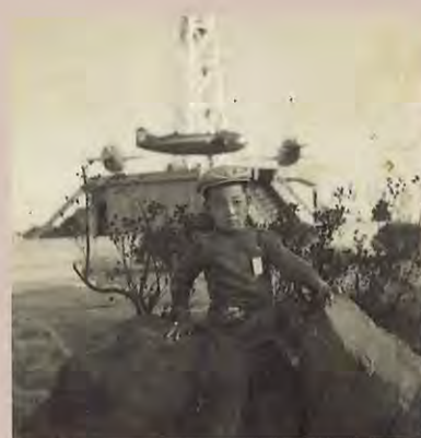
児童公園飛行塔の前で (昭和29年)