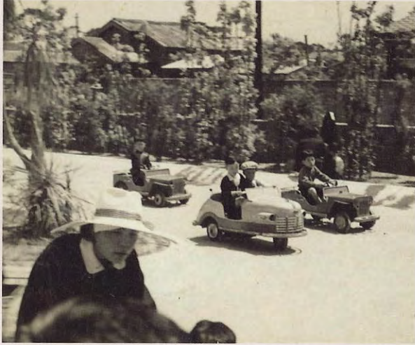
ペダルカー (昭和20年代後半)