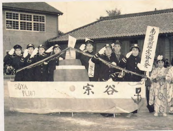
運動会の仮装行列 南極観測船宗谷（昭和33年）