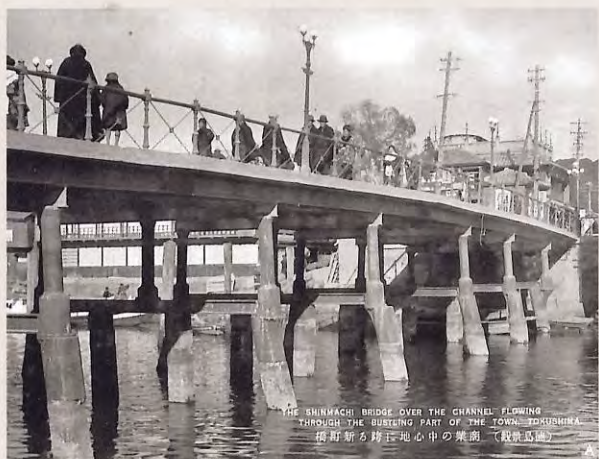
商業の中心地にまたがる新町橋 (戦前)