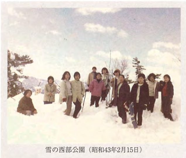
雪の西部公園 (昭和43年2月15日)