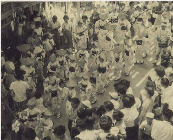
阿波踊りの賑わい (昭和20年代後半)