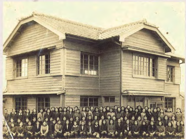
原裁縫技芸女学校 (昭和21年頃か)