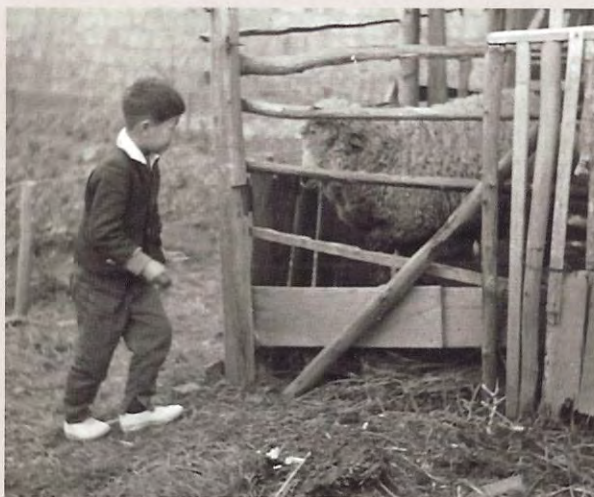
羊の飼育 (昭和30年代?)