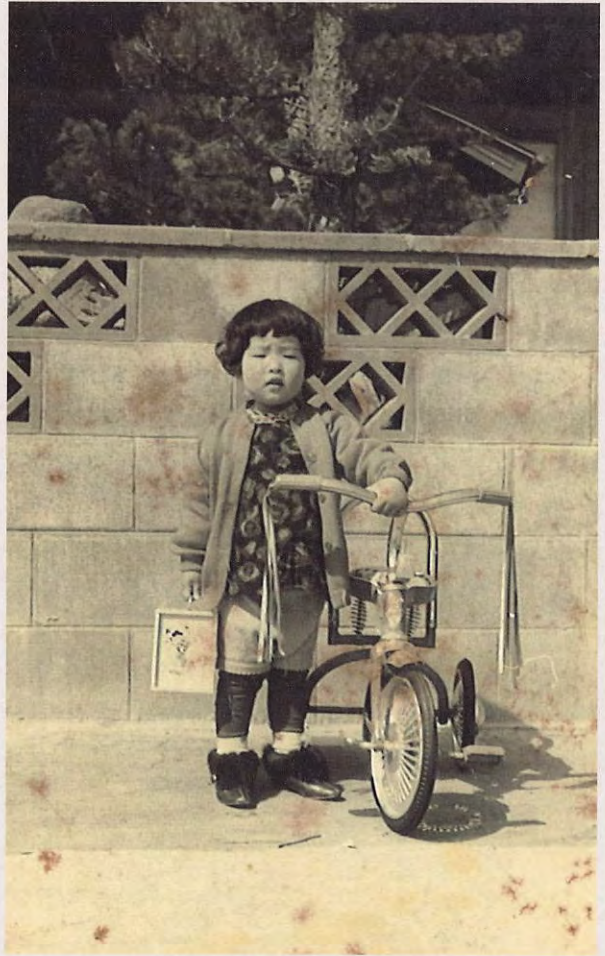
三輪車と遊山箱 (昭和40年代)