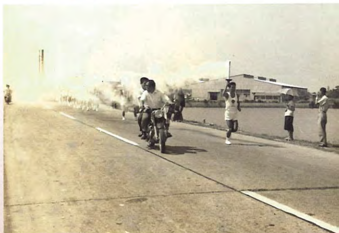
鳴門付近を走る聖火ランナー