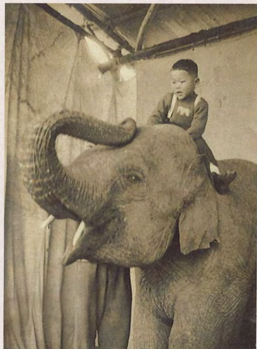
ぞうに乗って (昭和20年代後半)