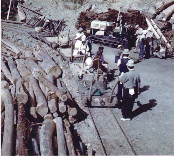
殿川内森林鉄道(上勝町) 炭俵を積んだトロッコ (昭和30年代)