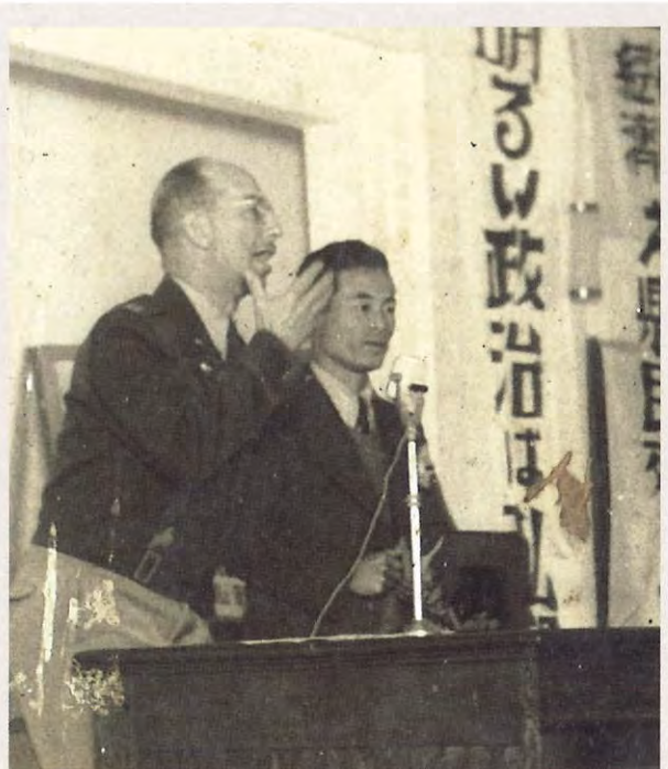
徳島県広報委員会での軍政部(GHQ)民間情報課長の講演 (昭和20年代前半)