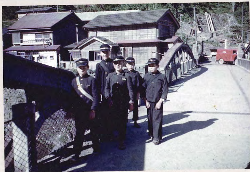
通学で落合橋を渡る中学生（昭和30年代）