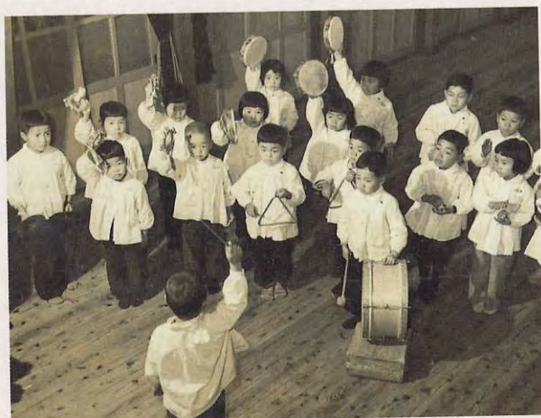
富田幼稚園リズム楽団（昭和29年頃）