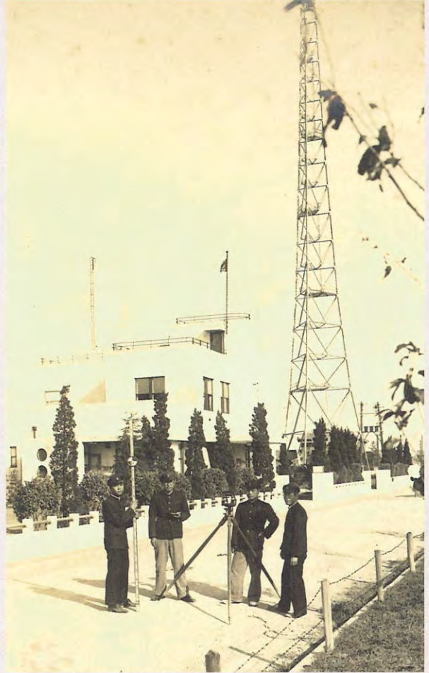
前川町NHK鉄塔前 測量演習 (昭和15年)