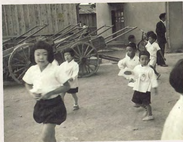
日の丸持って応援に（昭和20年代）