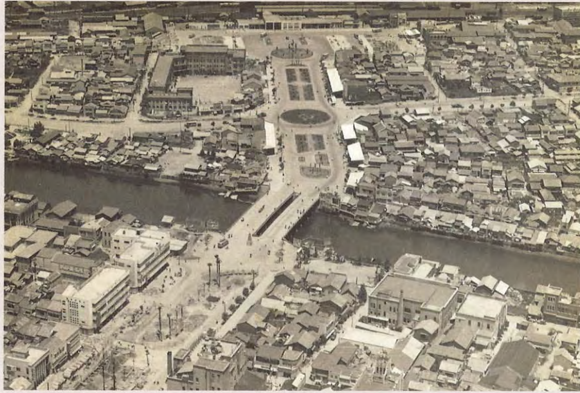
徳島の中心部航空写真 (昭和20年代後半)