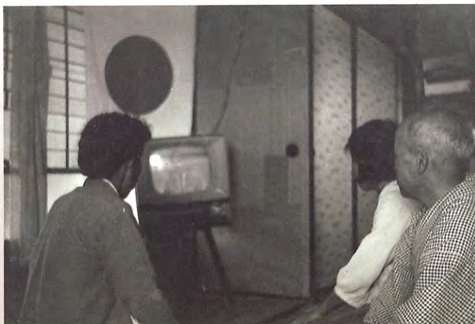
テレビで観戦した東京オリンピック