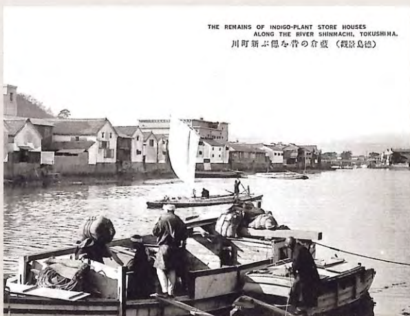
藍倉の昔を偲ぶ新町川 (戦前)