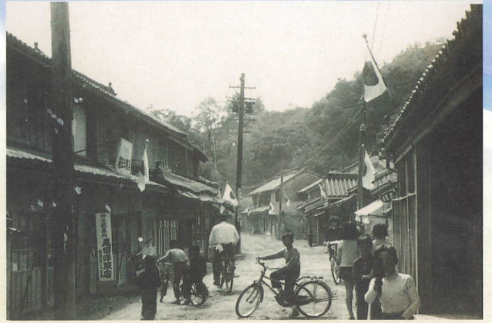
祝日の撫養街道の町並み 昭和30年代(徳島の100年取材写真)