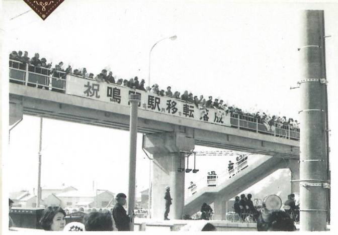
鳴門駅移転開業 昭和45年