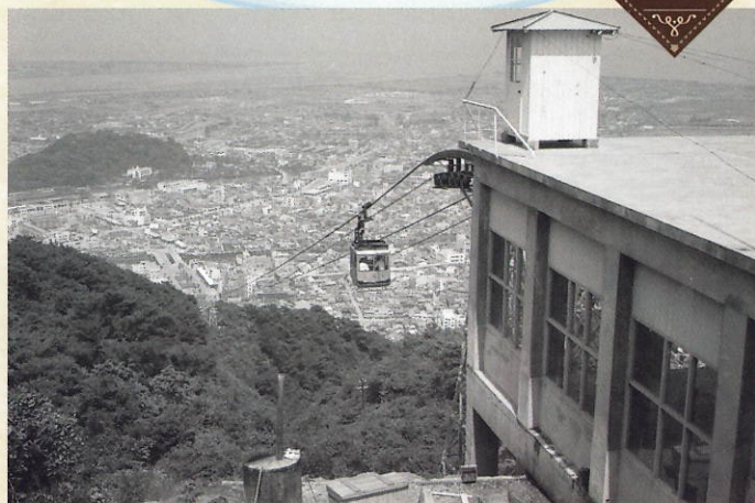
眉山ロープウェイと徳島の町 昭和36年