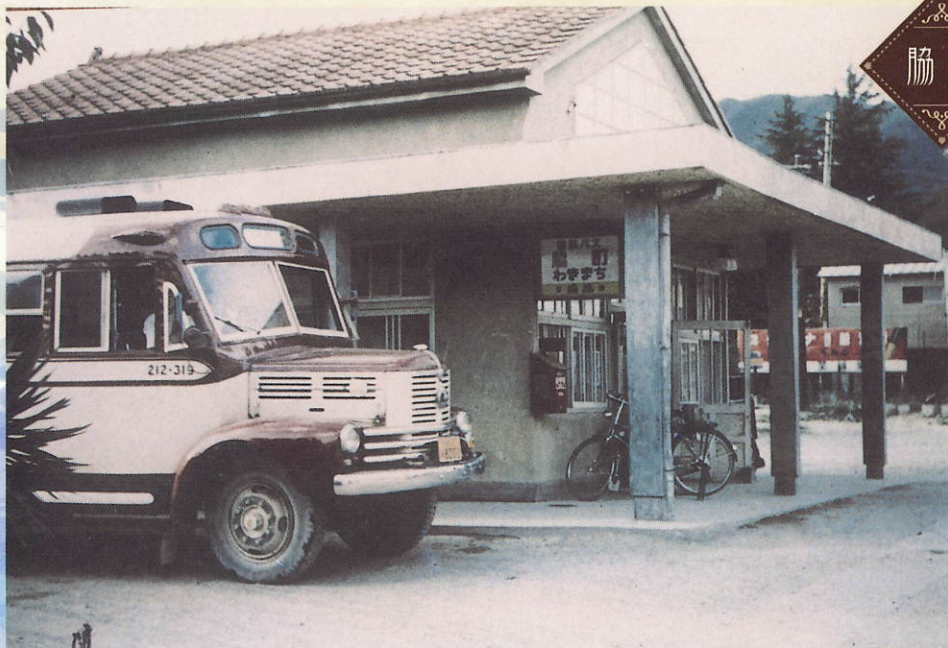
脇町駅(バス停) 昭和31年