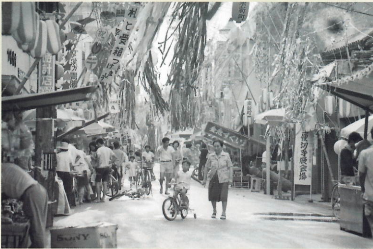
富岡町東新町天神祭 昭和30年代(木田家資料)