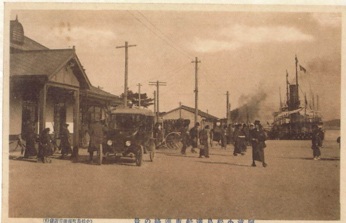
小松島港船車連絡の景 大正期(篠原家資料)