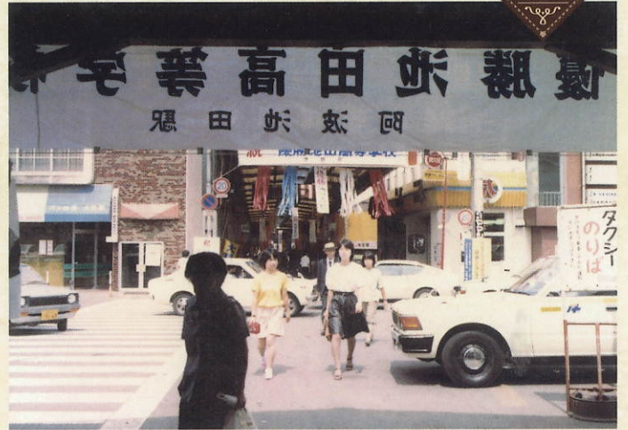
池田駅前 優勝池田高校の垂れ幕 昭和57年