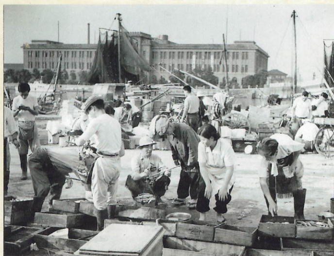
中洲の魚市場と徳島県庁 昭和30年頃(津田家資料)