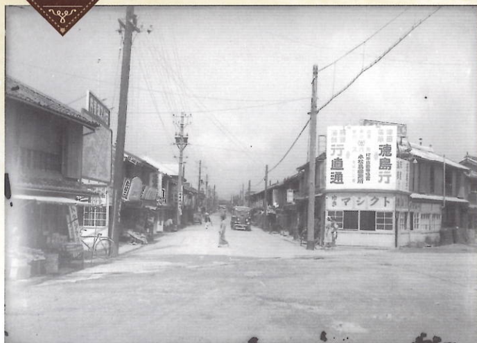
小松島駅前二条通り 昭和初期