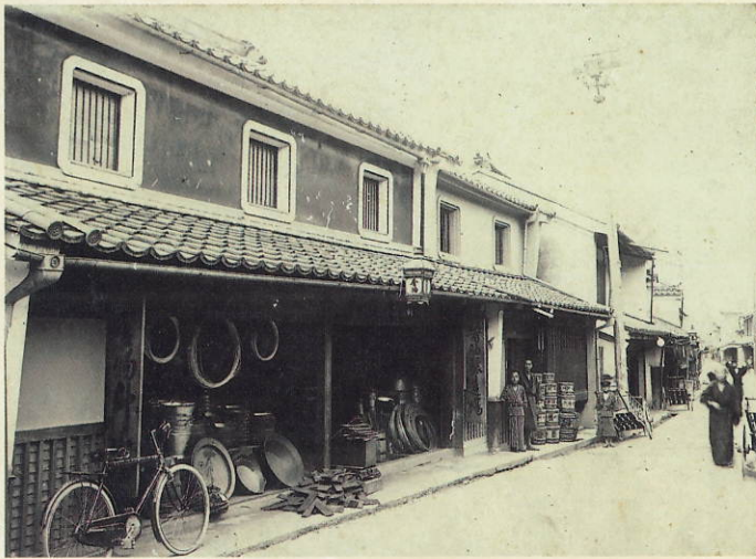
池田の町並み 讃野商店 大正期