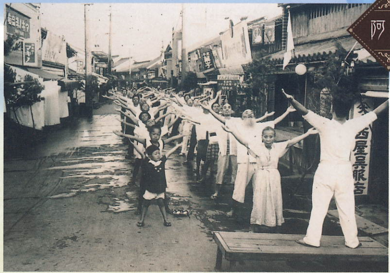
富岡町東新町ラジオ体操 昭和20年代(徳島の100年取材資料)