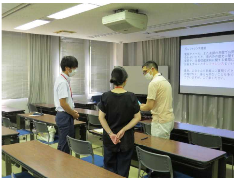
8.5 教員のための文書館活用講座

また、平成28年度より、県内の中学校社会科・高校地歴科教員を対象に開講し、文書館資料を地域史学習の教材として活用するヒントやノウハウを伝えている。令和3年度からは教職を目指す大学生・大学院生も対象に募集をおこなった。令和4年度は8月5日に実施。参加者は4名。