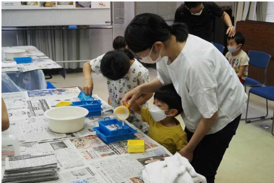
8.21 サマーフェスティバル紙漉き