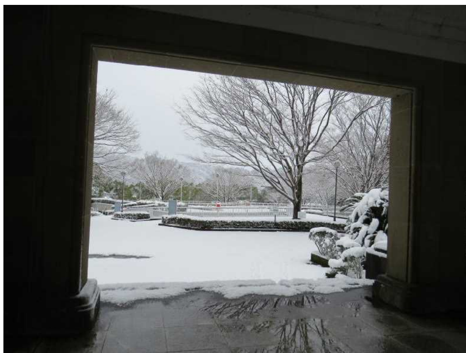
12.23 雪の日文書館正面