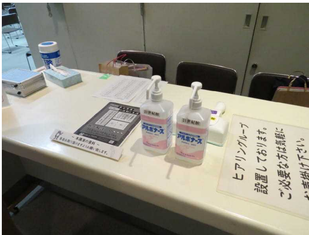
11.12 歴史講演会会場設営