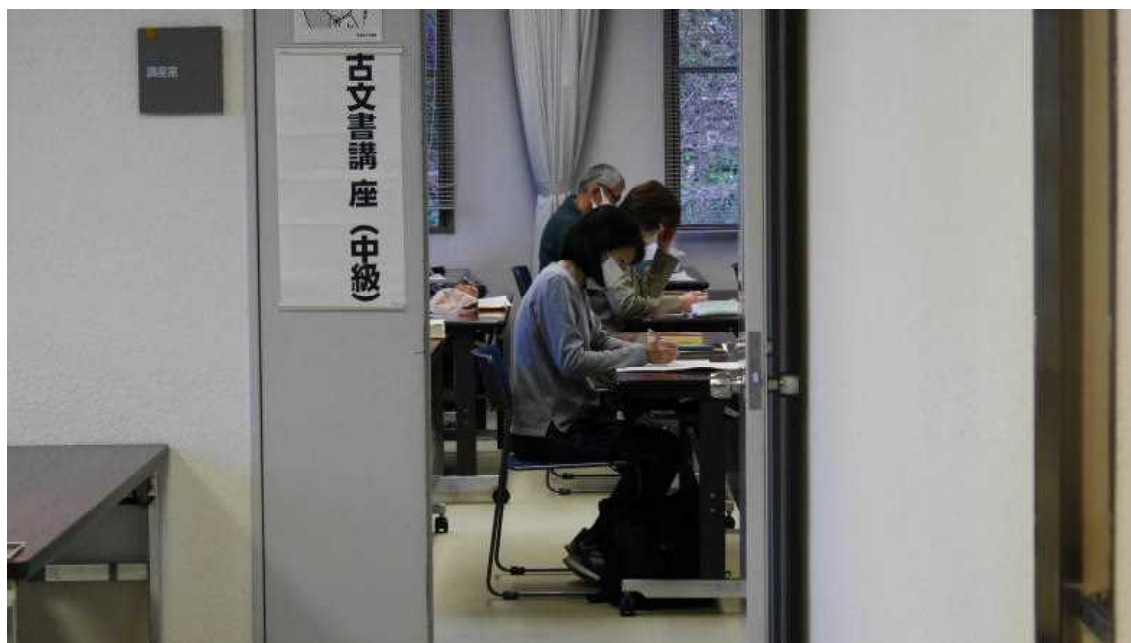
11.5 文書館古文書講座中級