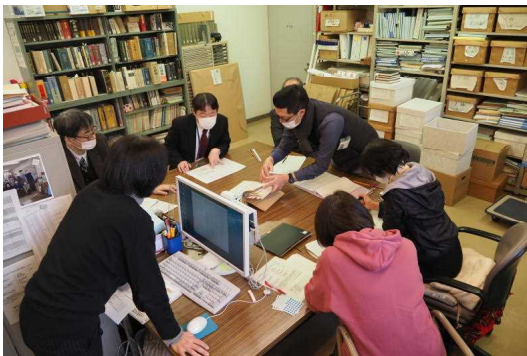
1.18 公文書公開審査会