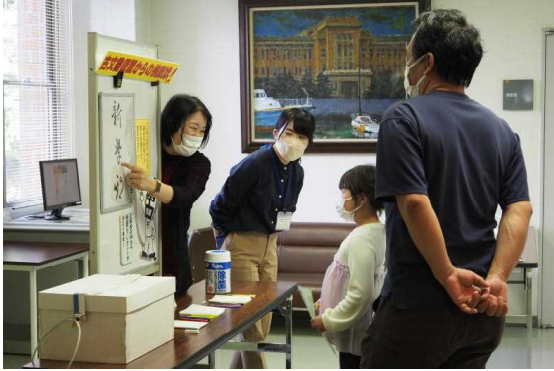
5.5 こどもの日フェスティバル