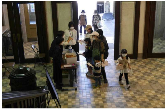
11.3 秋祭りクイズラリー