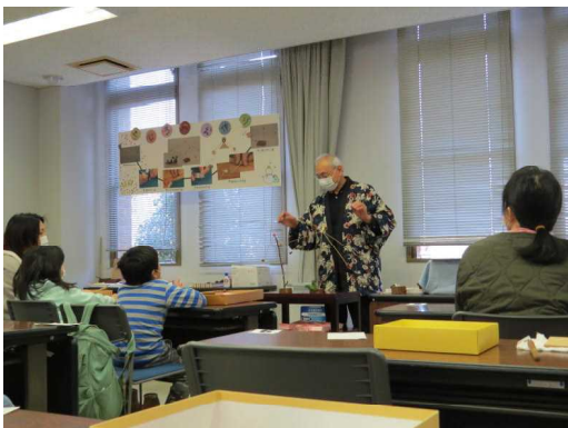
2.11 ウィンターフェスティバル