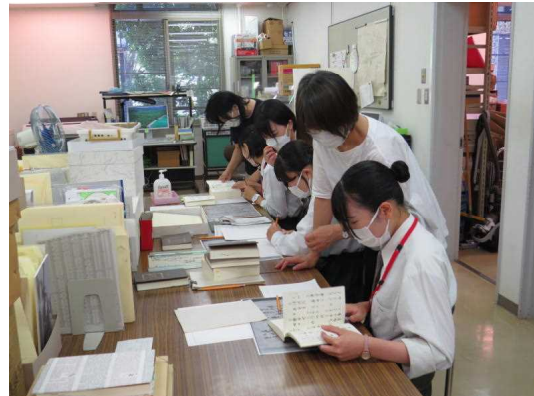
8.3 高校生インターンシップ（城南高校）