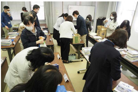
3.29 高等学校学校誌交換会