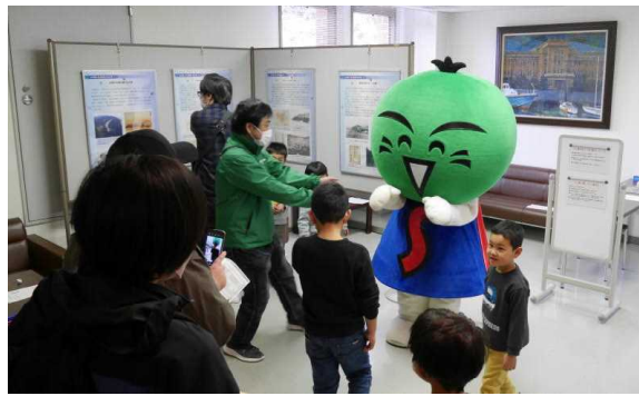
2.11 ウィンターフェスティバル