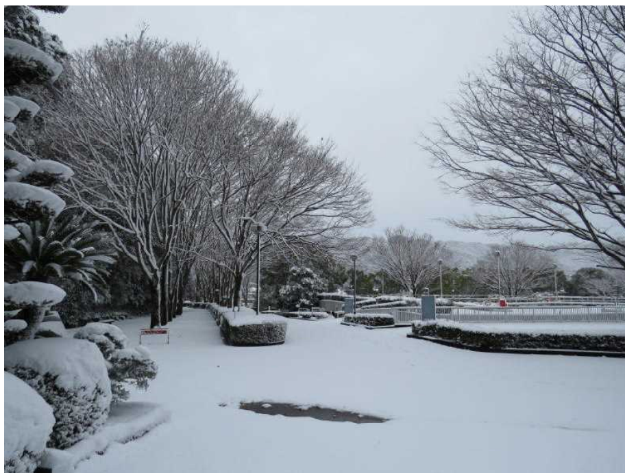
12.23 雪の日 文書館前