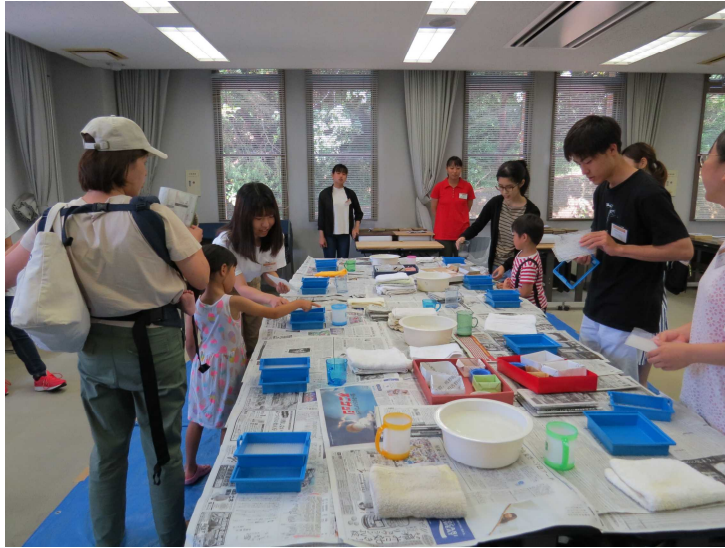
8.18 サマーフェスティバル