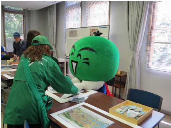
5.5 こどもの日フェスティバル