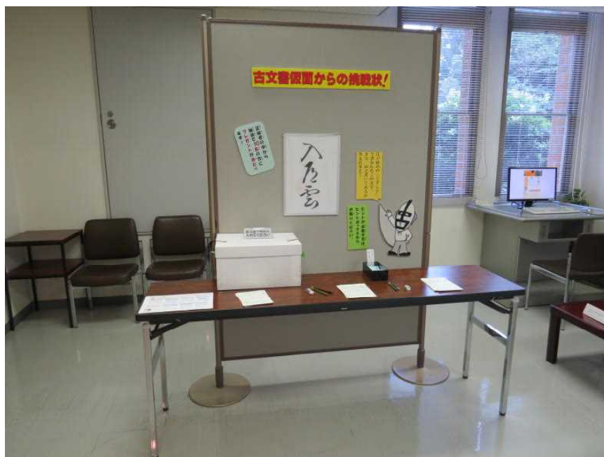
8.18 古文書クイズ会場