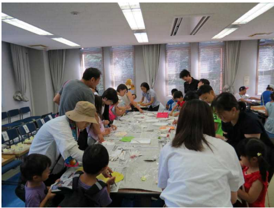
8.18 サマーフェスティバル