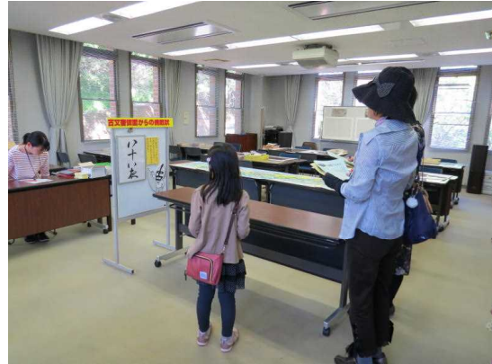
5.5 こどもの日フェスティバル