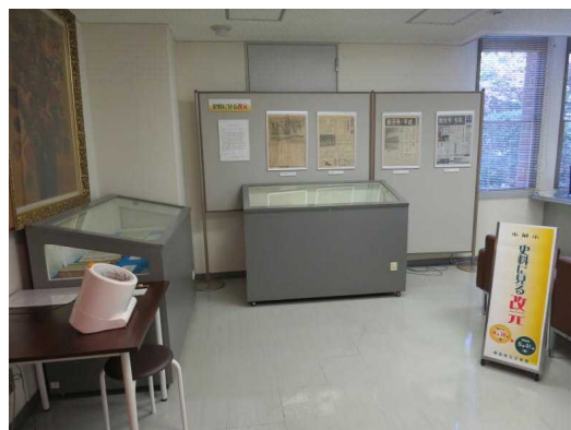
4.26 小展示「史料に見る改元」