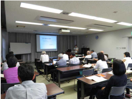
7.30 古文書保存講座 1日目