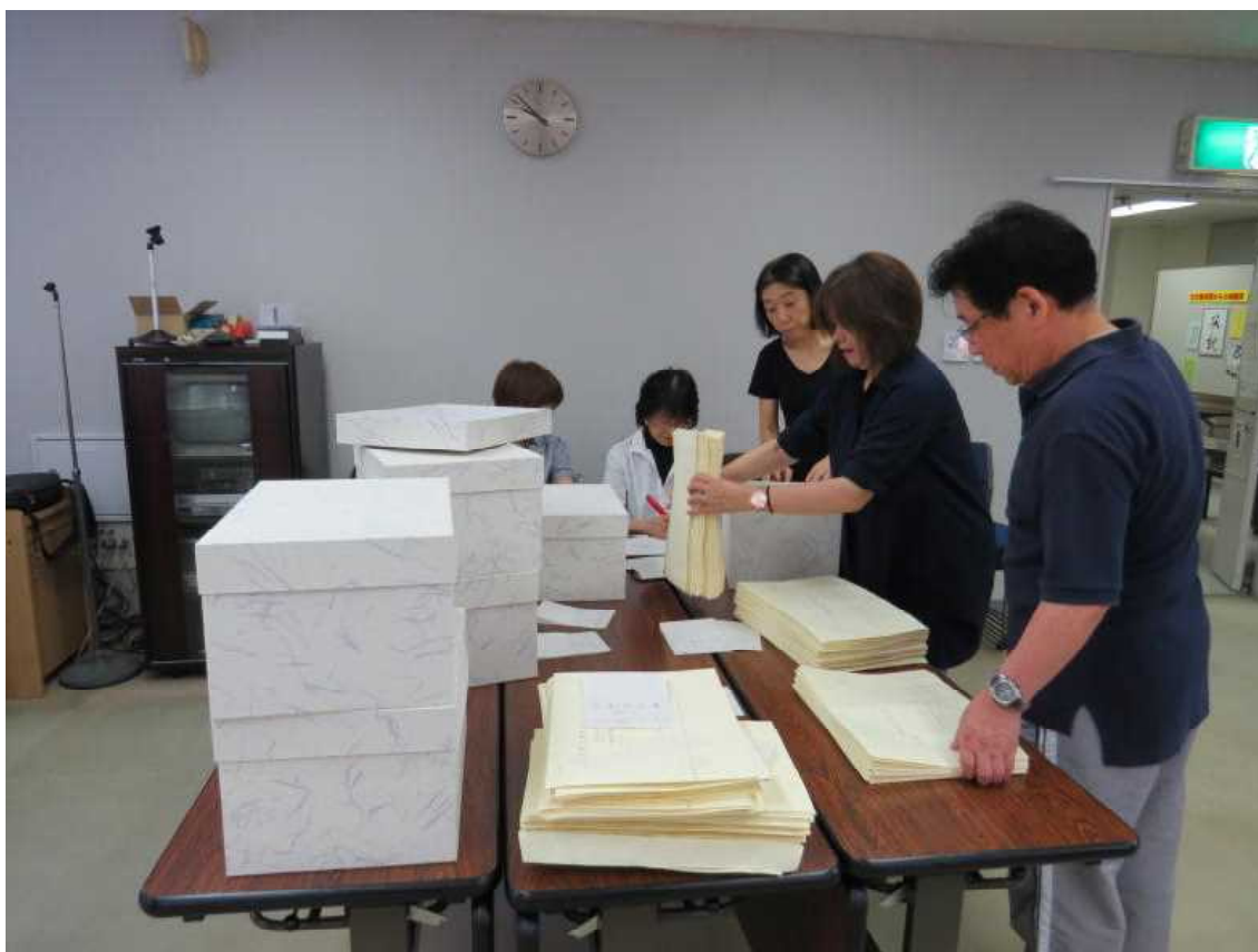
6.30 古文書箱の整理（講座室）