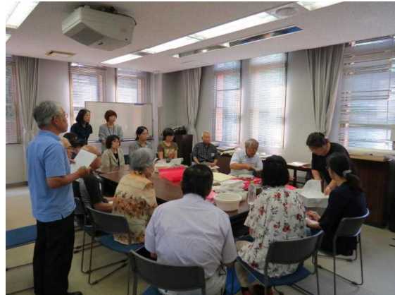
7.31 古文書保存講座 2日目