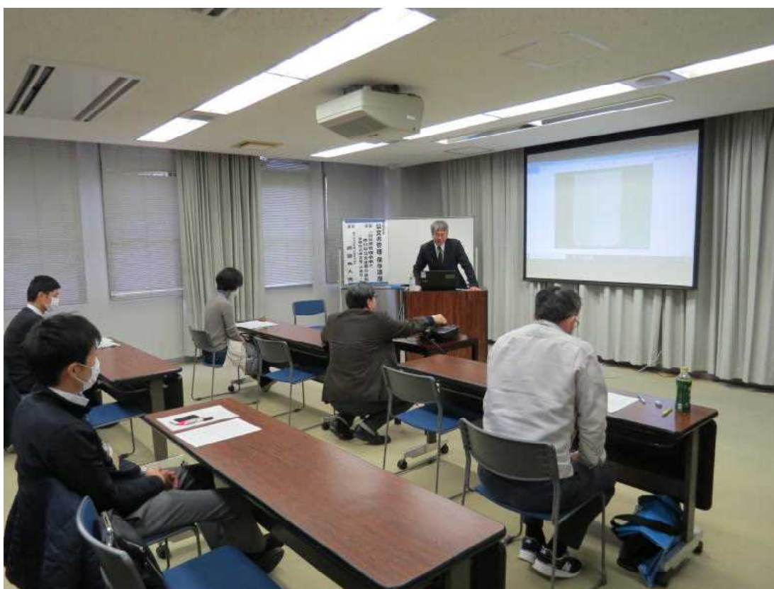
2.26 公文書管理保存講座 会場