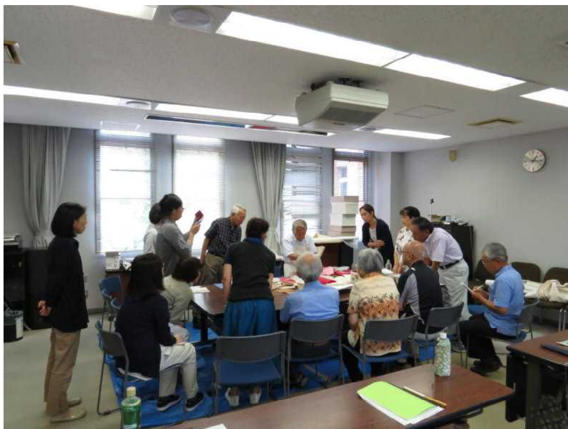
7.31 古文書保存講座 2日目