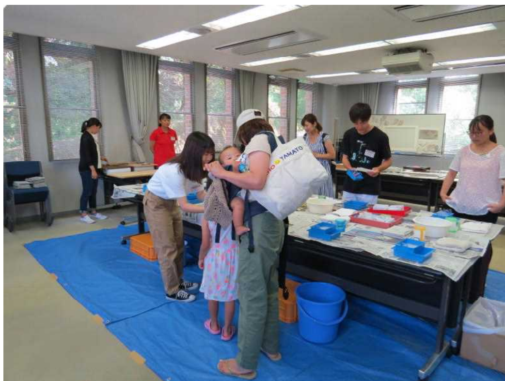
8.18 サマーフェスティバル