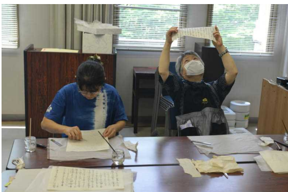
6.19 古文書保存ボランティアの活動